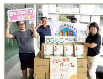
社團法人聽語障福利協進會