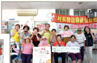
口湖後厝社區-長青食堂