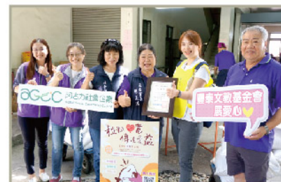
斗六長安社區-長青食堂