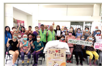
北港灣內社區-長青食堂