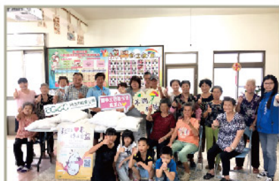
四湖羊調社區-長青食堂