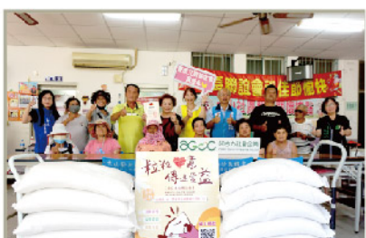
水林大山社區-長青食堂