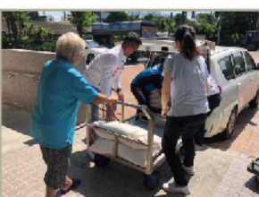
崙背南陽社區-長青食堂