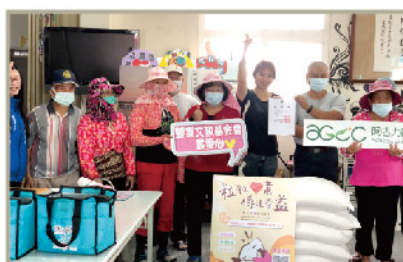
口湖成龍社區-長青食堂