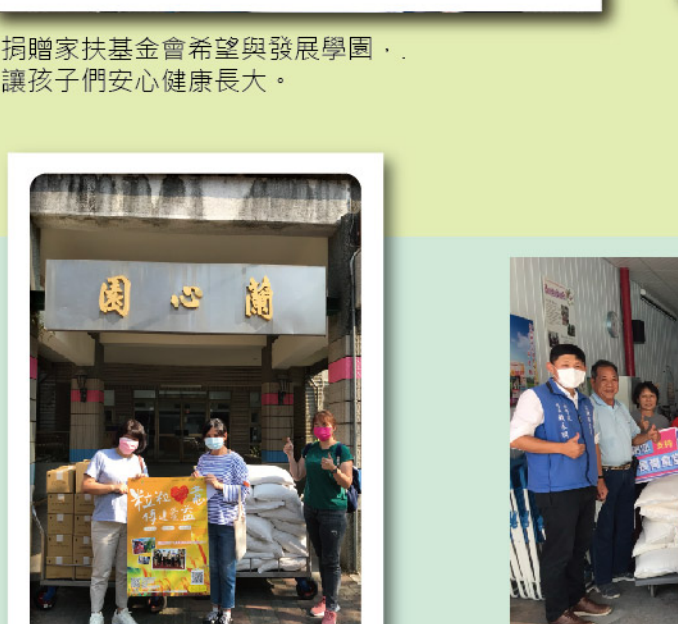
捐贈家扶基金會希望與發展學園， 讓孩子們安心健康長大。