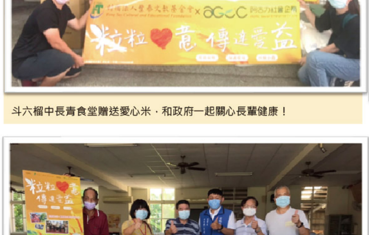
90多歲的 阿公也是 長青食堂的 志工喔