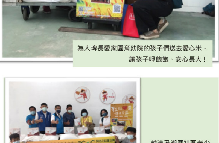
為大埤長愛家園育幼院的孩子們送去愛心米， 讓孩子吃得飽、安心長大！