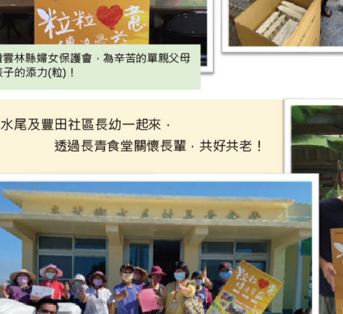
西螺老人會贈送愛心米，長輩們充滿活力！