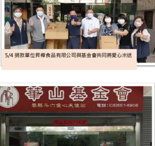
5/4 捐款單位昇昇食品有限公司與基金會共同將愛心米送