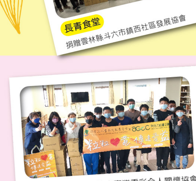
長青食堂 捐贈雲林縣斗六市鎮西社區發展協會