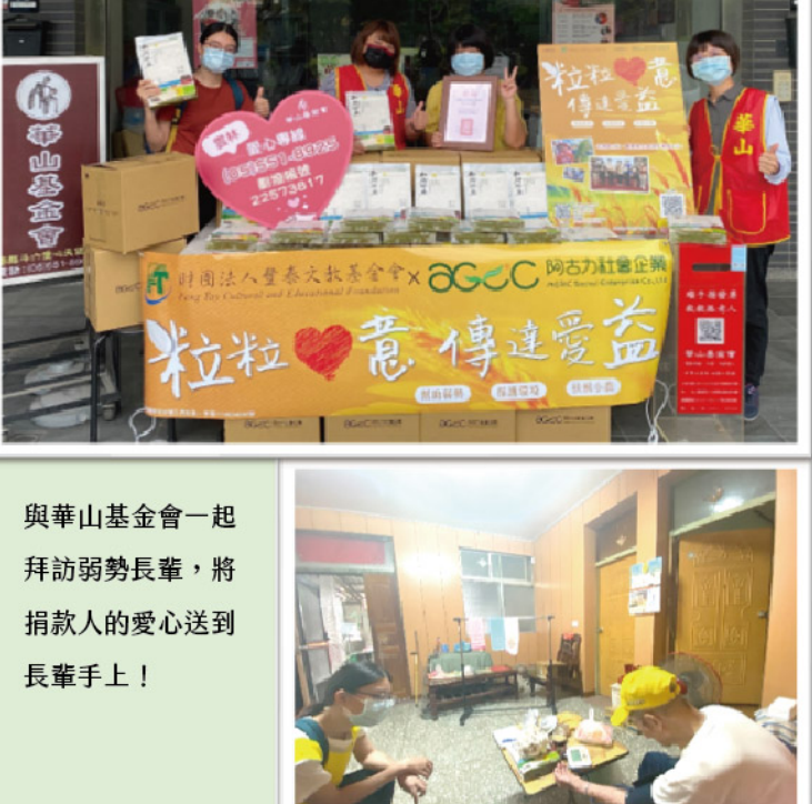
與華山基金會一起 拜訪弱勢長輩，將 捐款人的愛心送到 長輩手上！