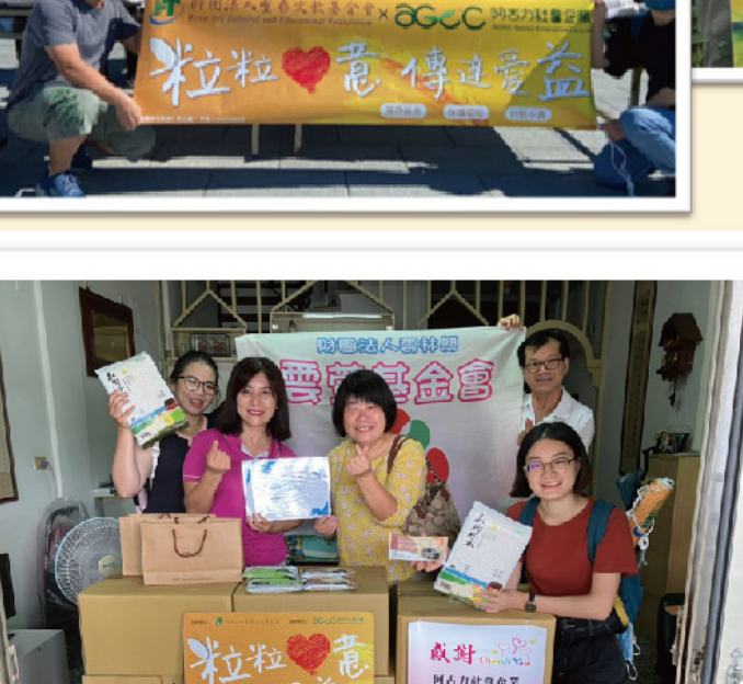
捐贈雲林縣婦女保護會，為辛苦的單親父母 及孩子的添力(粒)！