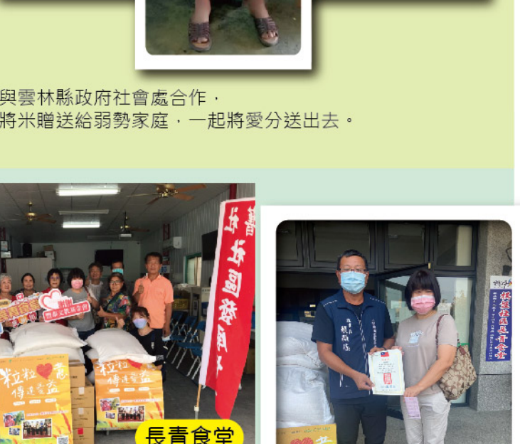
與雲林縣政府社會處合作， 將米贈送給弱勢家庭，一起將愛分送出去。