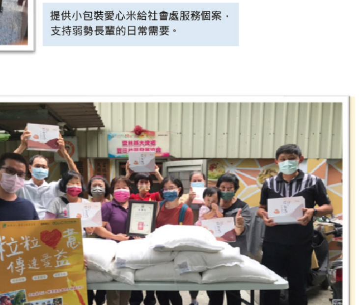
提供小包裝愛心米給社會處服務個案， 支持弱勢長輩的日常需要。