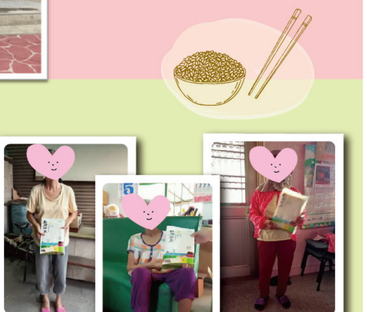
讓我們用友善無毒的米， 關心聽語障的朋友們，陪伴他們。