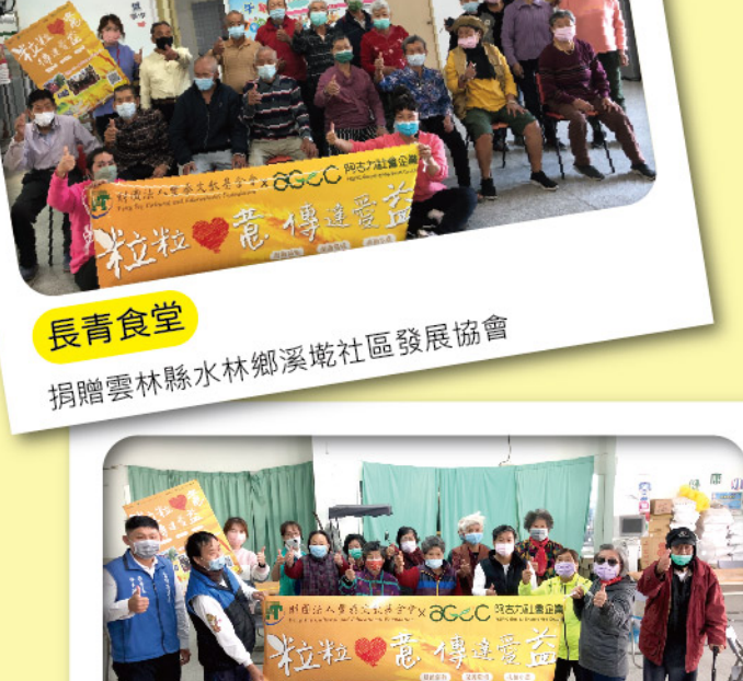
長青食堂 捐贈雲林縣長官鄉發展關懷協會