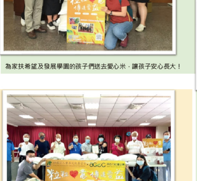
為家扶希望及發展學園的孩子們送去愛心米，讓孩子安心長大！