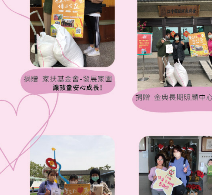
長青食堂 捐贈 社團法人臺灣雲彩名人關懷協會