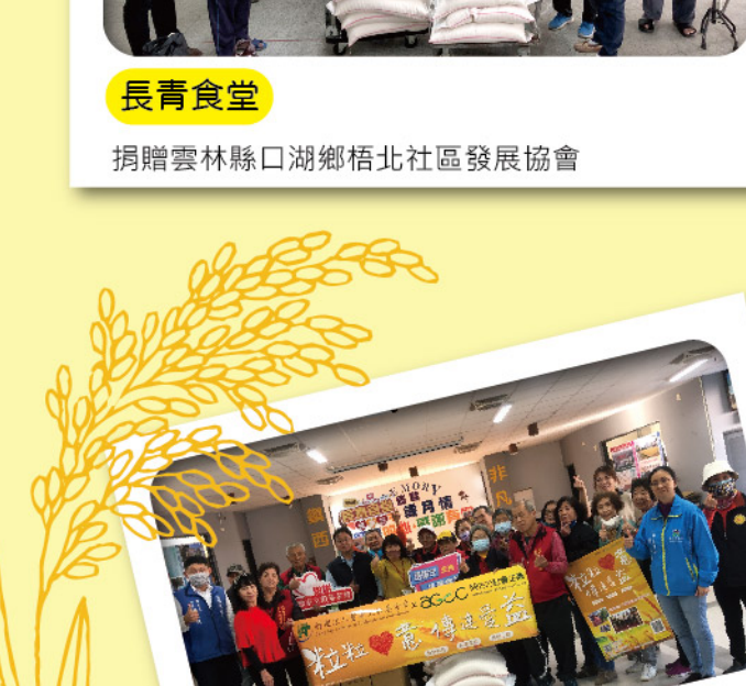
長青食堂 捐贈雲林縣水林鄉溪潭社區發展協會