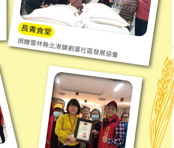
長青食堂 捐贈雲林縣四湖鄉飛東社區發展協會