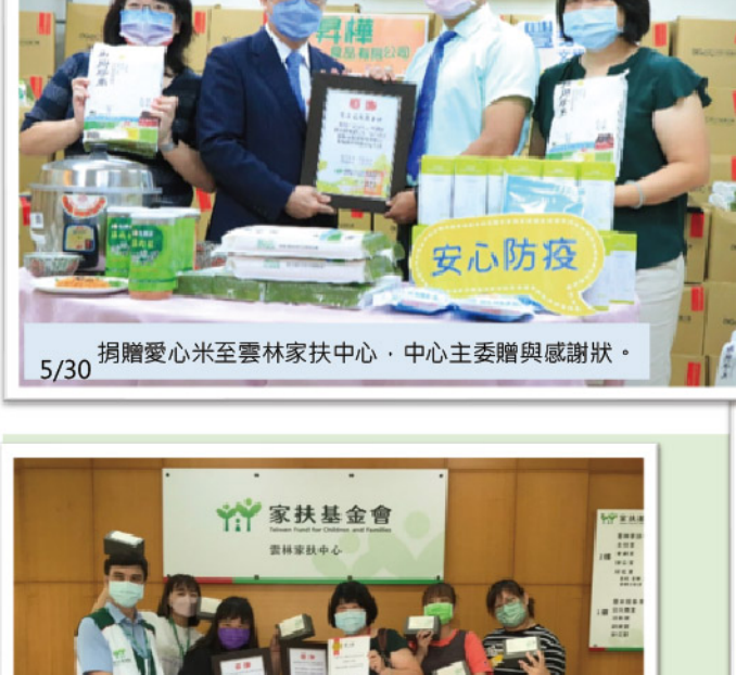
5/30 捐贈愛心米至雲林家扶中心，中心主委贈與感謝狀。