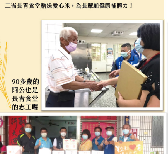
二崙長青食堂贈送愛心米，為長輩健康補體力！