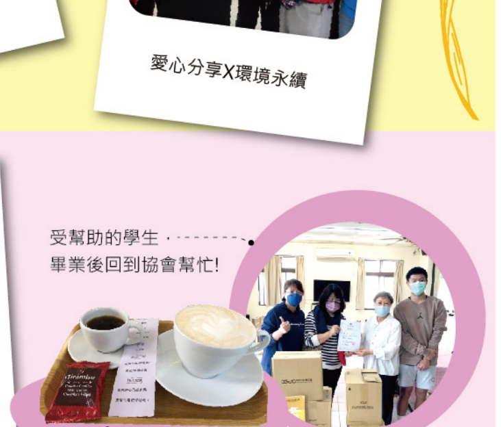
長青食堂 捐贈雲林縣北港鎮劍厝社區發展協會