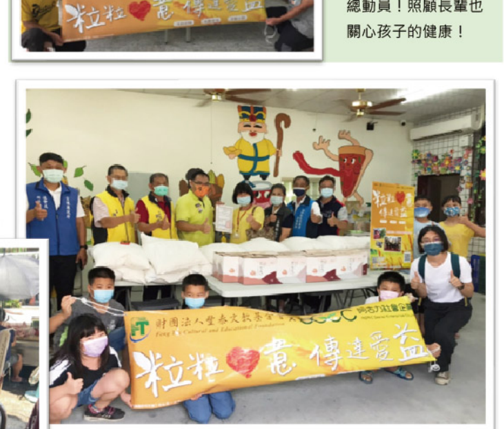
越港及潮厝社區老少 總動員！照顧長輩也 關心孩子的健康！