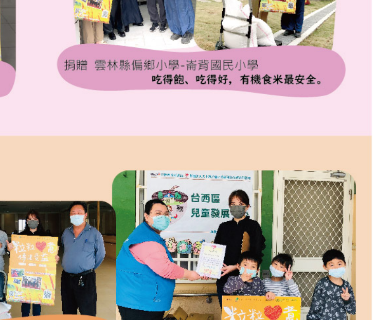
長青食堂 捐贈 社團法人雲林縣身心照護協會