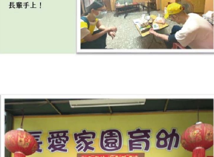
與華山基金會一起拜訪弱勢長輩，將捐款人的愛心送到長輩手上!