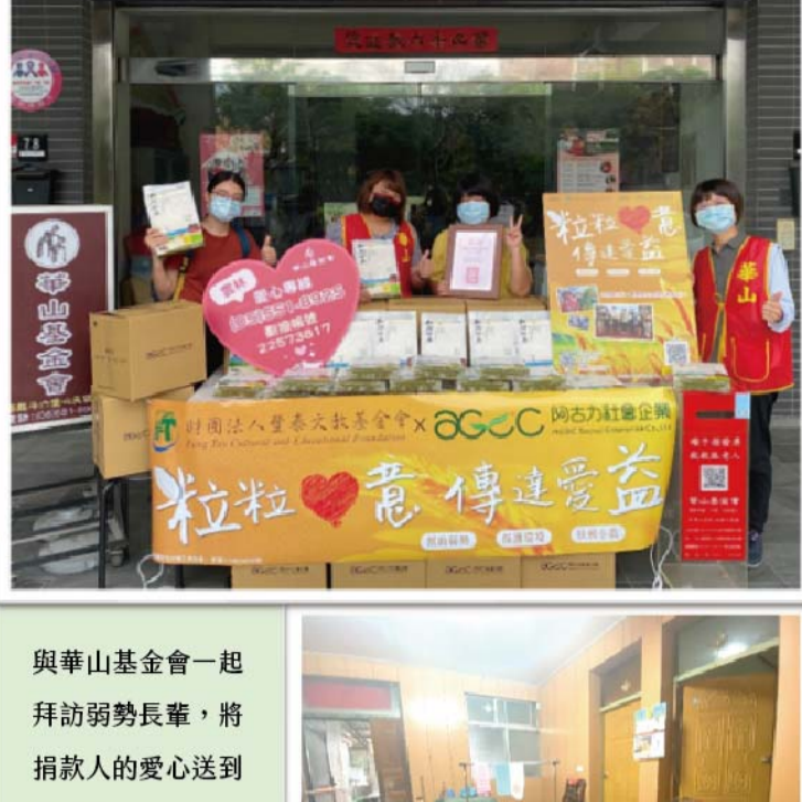
與華山基金會一起拜訪弱勢長輩，將捐款人的愛心送到長輩手上!