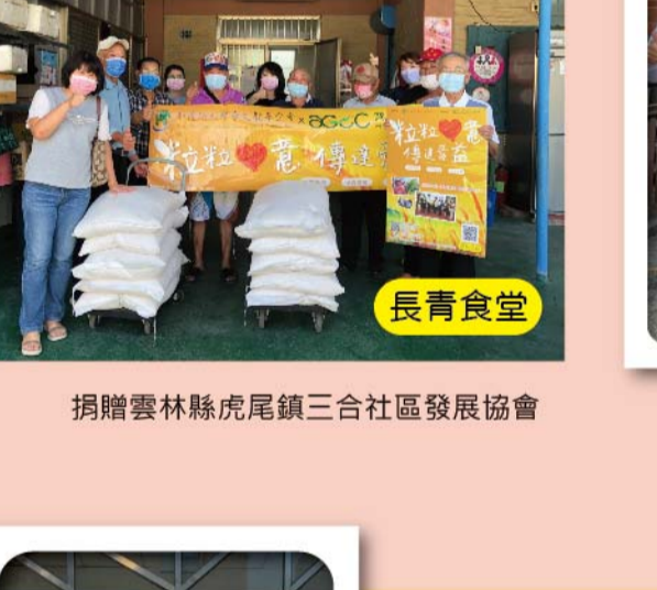
捐贈雲林縣虎尾鎮三合社區發展協會