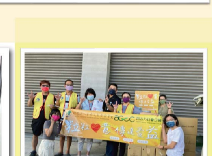
讓我們用友善無毒的米・關心聽語障的朋友們・陪伴他們・