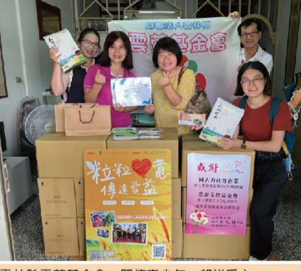
雲林縣雲蓋基金會・關懷青少年一起送愛心