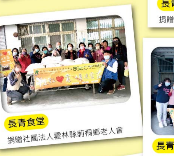
捐贈雲林縣東勢鄉四美社區發展協會