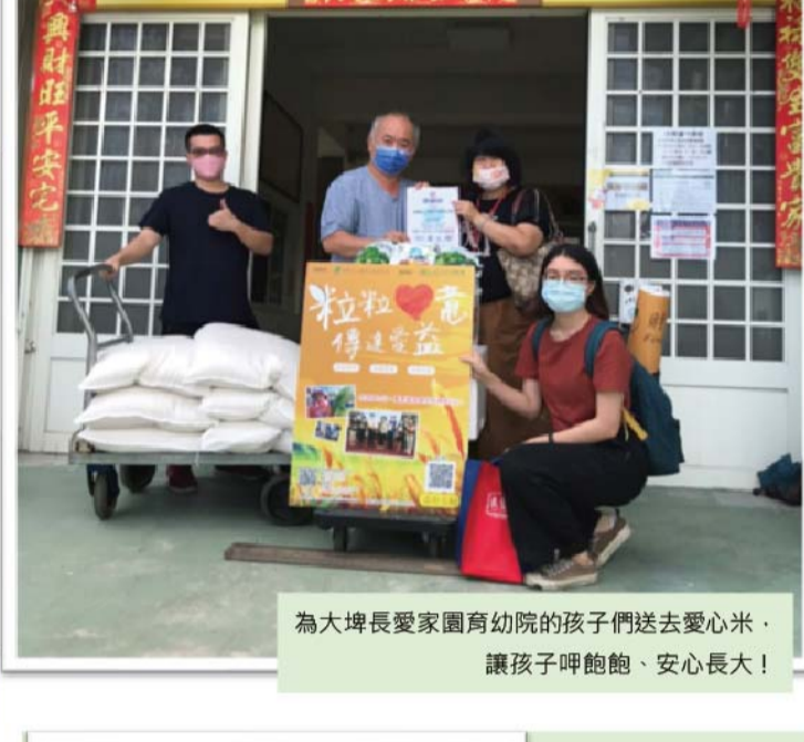
為大埤長愛家園育幼院的孩子們送去愛心米・讓孩子呼飽飽・安心長大!