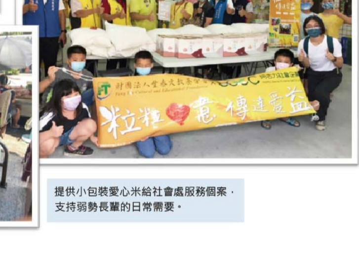
提供小包裝愛心米給社會處服務個案・支持弱勢長輩的日常需要・