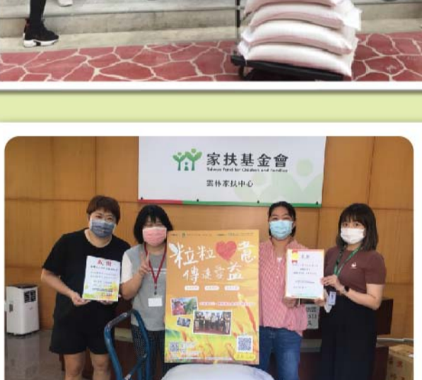
與雲林縣政府社會處合作・將米贈送給弱勢家庭・一起將愛分送出去・