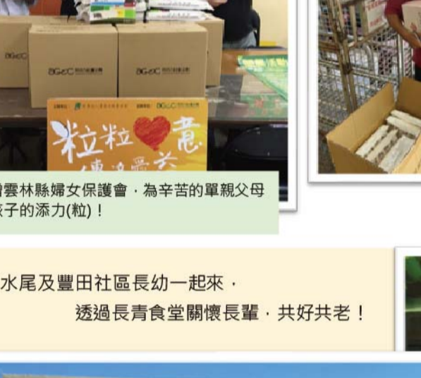
捐贈雲林縣婦女保護會・為辛苦的單親父母及孩子的添力(粒)!