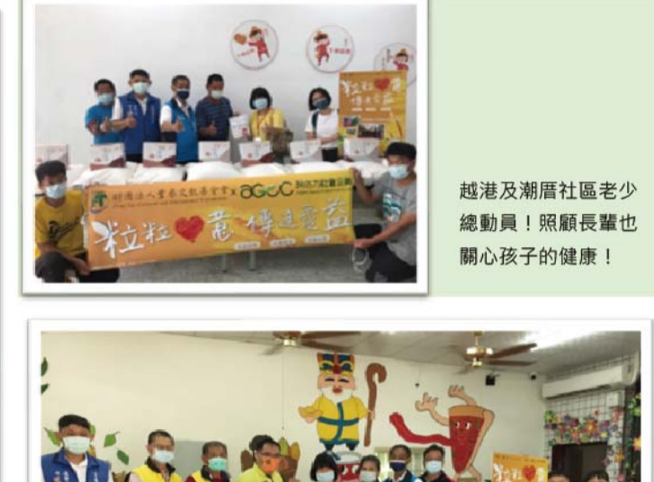
越港及潮厝社區老少總動員!照顧長輩也關心孩子的健康!