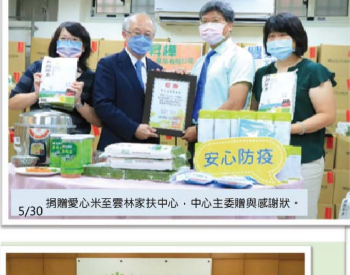
5/30 捐贈愛心米至雲林家扶中心・中心主贈與感謝狀・