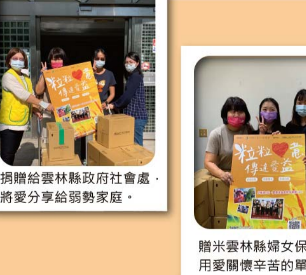
捐贈給雲林縣政府社會處・將愛分享给弱勢家庭・