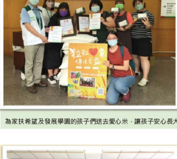
為家扶希望及發展學園的孩子們送去愛心米・讓孩子安心長大!