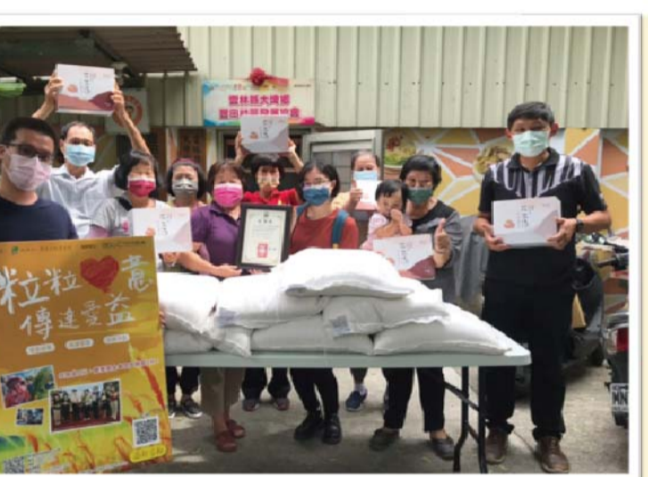
水尾及豐田社區長幼一起來・透過長青食堂關懷長輩・共好共老!