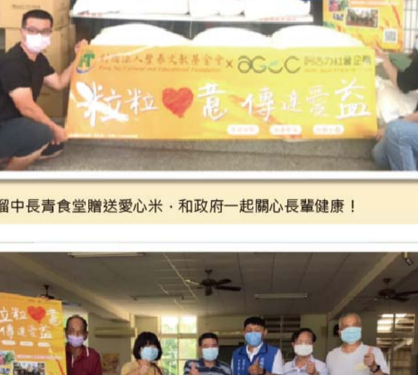
斗六糧中長青食堂贈送愛心米，和政府一起關心長輩健康!