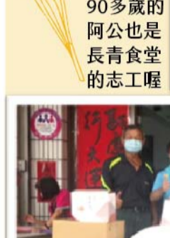
90多歲的阿公也是長青食堂的志工