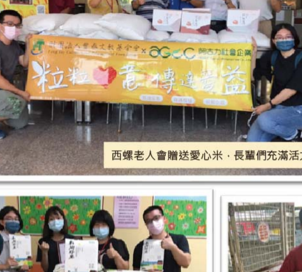
西螺老人會贈送愛心米・長輩們充滿活力!