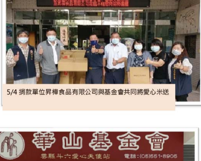
5/4 捐款單位昇楷食品有限公司與基金會共同將愛心米送