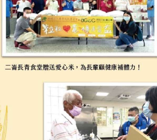
二崙長青食堂贈送愛心米，為長輩健康補體力!