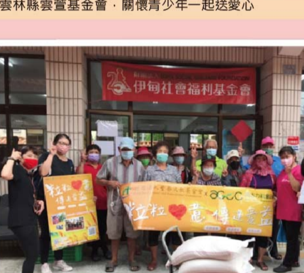
捐贈家扶基金會希望與發展學園・讓孩子們安心健康長大・