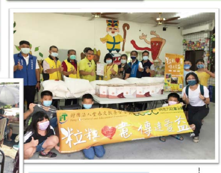
提供小包裝愛心米給社會處服務個案，支持弱勢長輩的日常需要。