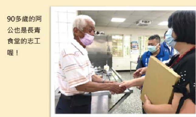
90歲的阿公也是長青食堂的志工喔！