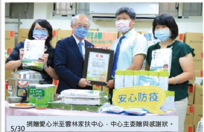
5/30 捐贈愛心米至雲林家扶中心，中心主任贈與感謝狀。