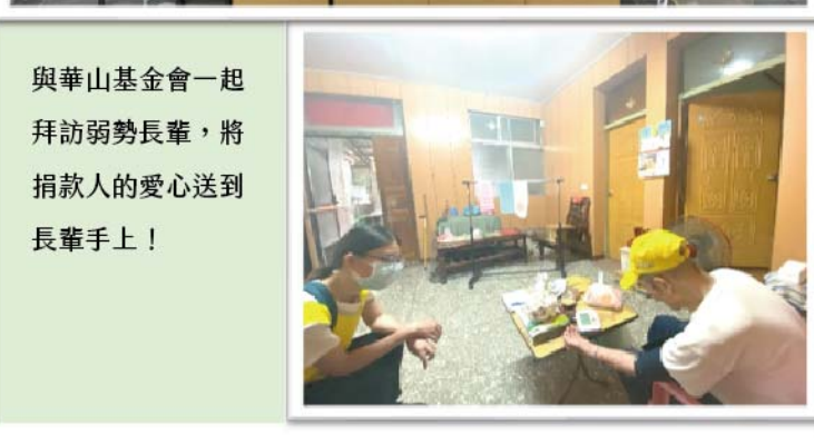
與華山基金會一起拜訪弱勢長輩，將捐款人的愛心送到長輩手上！