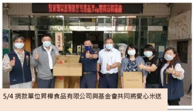
5/4 捐款單位昇樺食品有限公司與基金會共同將愛心米送