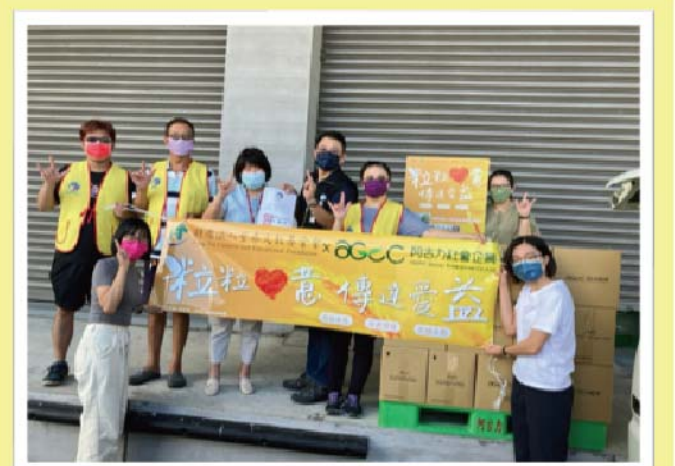
讓我們用友善無毒的米，關心聽語障的朋友們，陪伴他們。