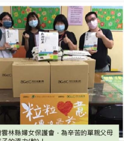
捐贈雲林縣婦女保護會，為辛苦的單親父母及孩子的添力(粒)！