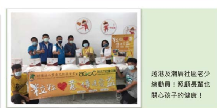
越港及潮厝社區老少總動員！照顧長輩也關心孩子的健康！