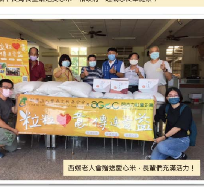
西螺老人會贈送愛心米，長輩們充滿活力！