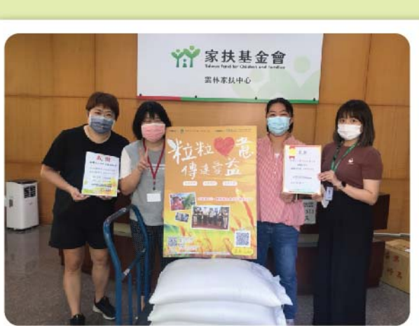
捐贈家扶基金會希望與發展學園，讓孩子們安心健康長大。