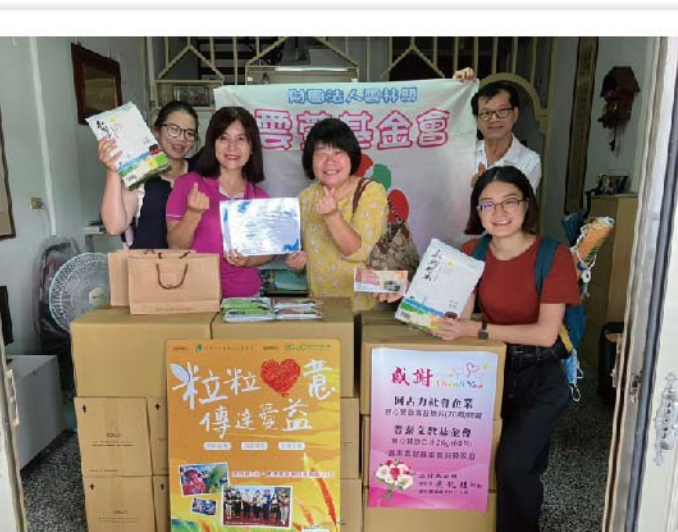
雲林縣雲萱基金會，關懷青少年一起送愛心