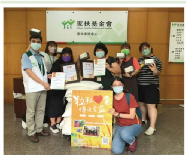
為家扶希望及發展學園的孩子們送去愛心米，讓孩子安心長大！