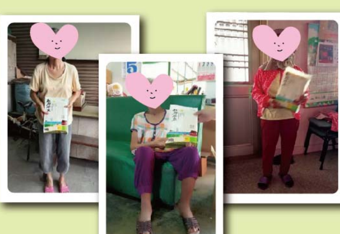
與雲林縣政府社會處合作，將米贈送給弱勢家庭，一起將愛分送出去。