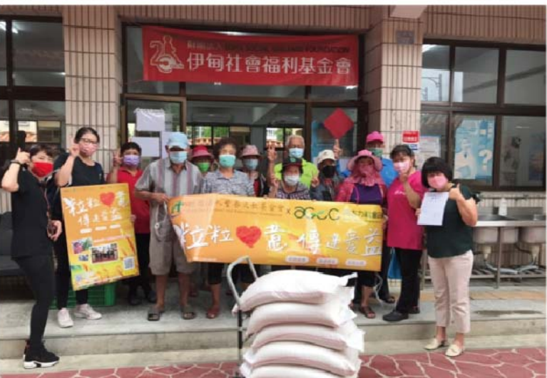
捐贈伊甸社會福利基金會，將愛分享给二崙田尾長青食堂