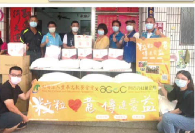
斗六榴中長青食堂贈送愛心米，和政府一起關心長輩健康！