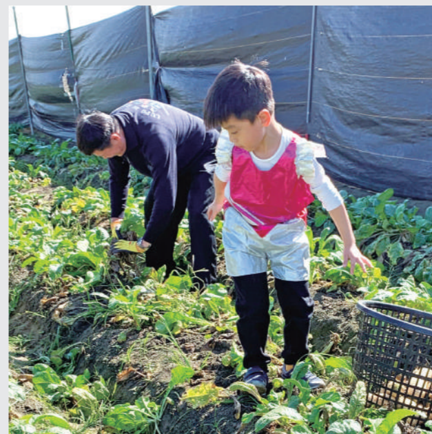
和平國小蘿蔔製作感恩豐年祭