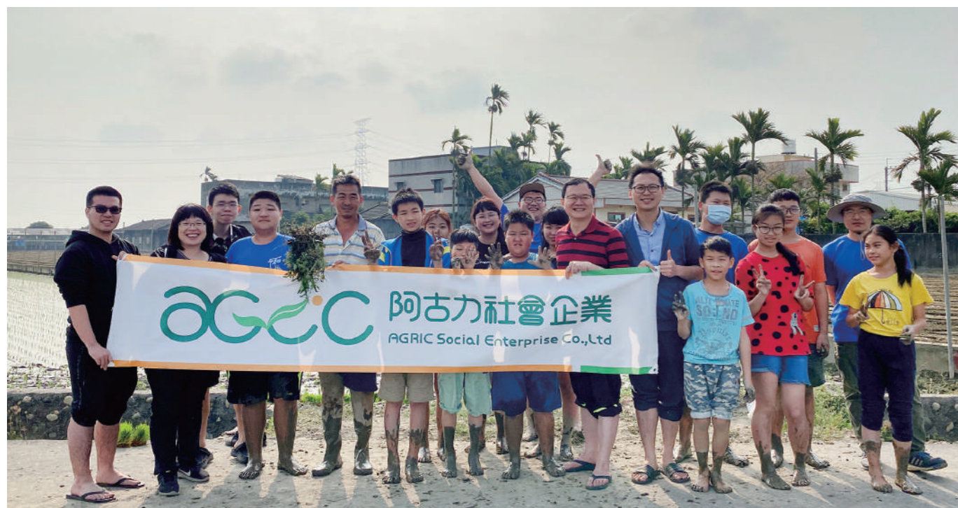
和平國小稻米製作插秧活動

阿古力自2019年推出團結共好專案，企劃、生產、製造三方緊密結合，嚴選在地堅持有機耕作的一復有機園，結合西螺人最愛的瑞春醬油，「很會種的小農搭上很會製醬的百年醬油廠，加上味蕾挑剔的品評團隊」，圓潤飽滿的台南5號黃仁黑豆甕釀曝曬180天後，產出了在雲林土生土長、豆香濃郁的小農醬油，因為純粹，一上市也喚起老饕們對童年醬油的悠遠記憶。今年，新的一批黑豆正在陶甕裡醱釀，即將開甕煮醬成更具健康概念的有機薄鹽醬油。