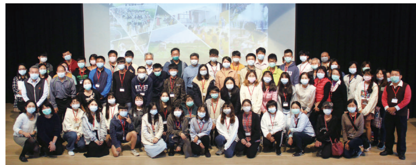
新生座談會全體合影