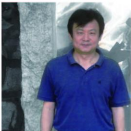
董 事 / 張良輝 國立雲林科技大學 環境與安全衛生工程系 教授兼系所主任