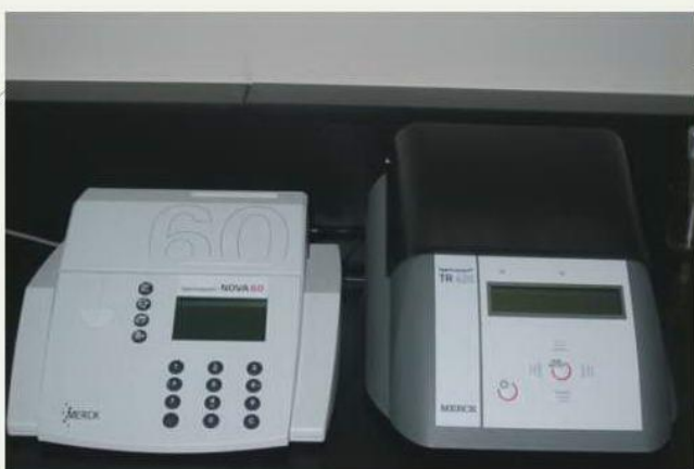
水質分析儀 分析項目：水中生化需氧量(BOD) 水中化學需氧量(COD)