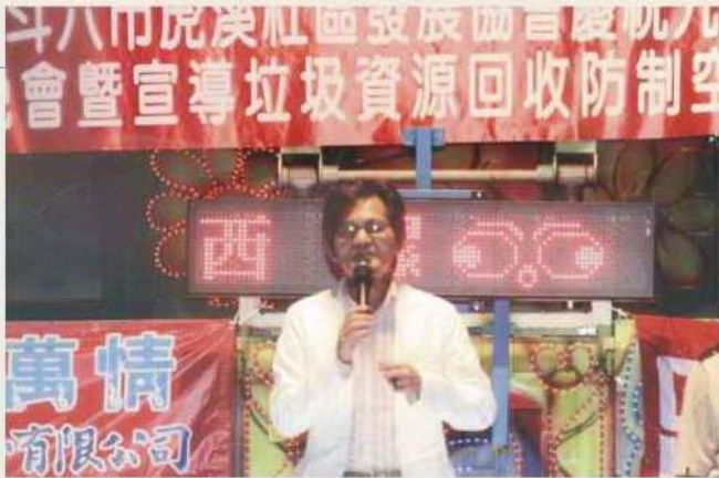
虎溪社區發展協會 母親節表揚暨社區教育宣導活動