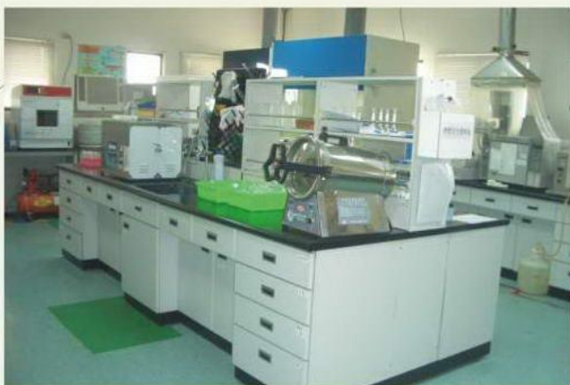
無機化合物分析室之一角