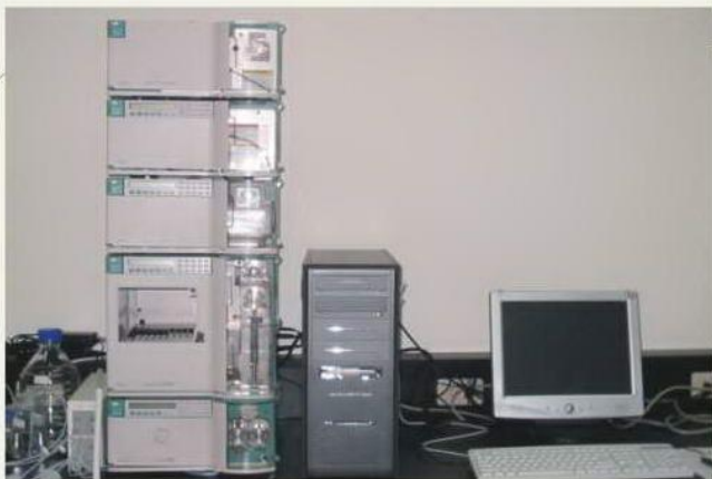
HPLC 液相層析儀 分析項目：分散性染料、偶氮等。