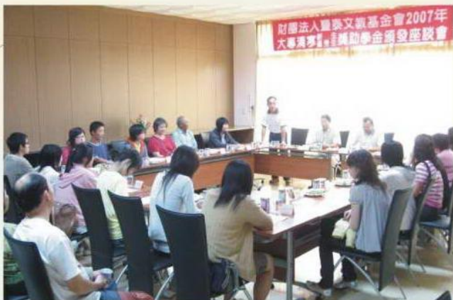
大專清寒新生暨優秀生獎助學金頒發座談會