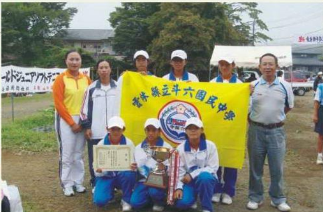
斗六國中網球隊 日本國際青少年軟式網球錦標賽