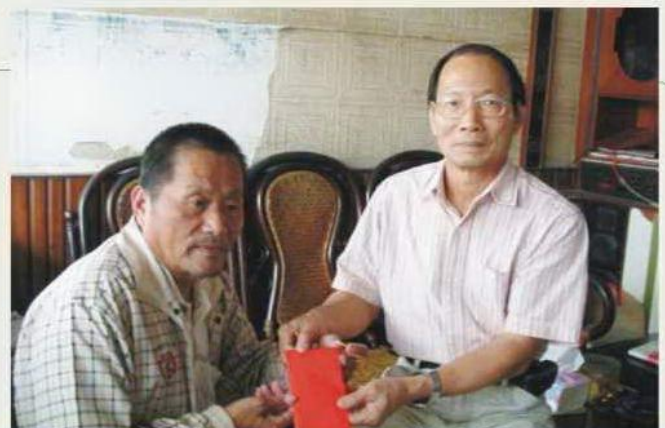
斗六市急難家庭救濟