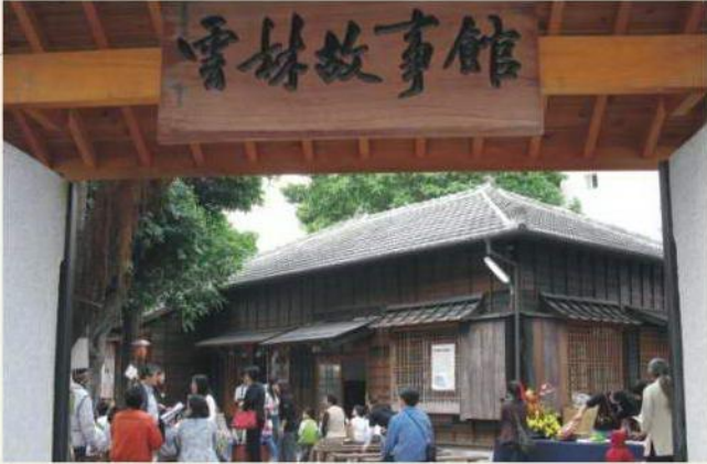
雲林縣政府—成立雲林故事館