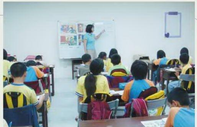
雲林縣照顧服務發展協會 □湖鄉下崙弱勢家庭兒童課輔活動