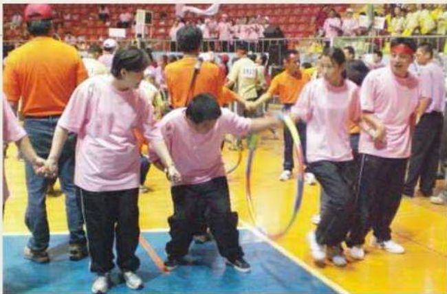
康復之友協會 台灣地區康復之友鳳凰盃運動會