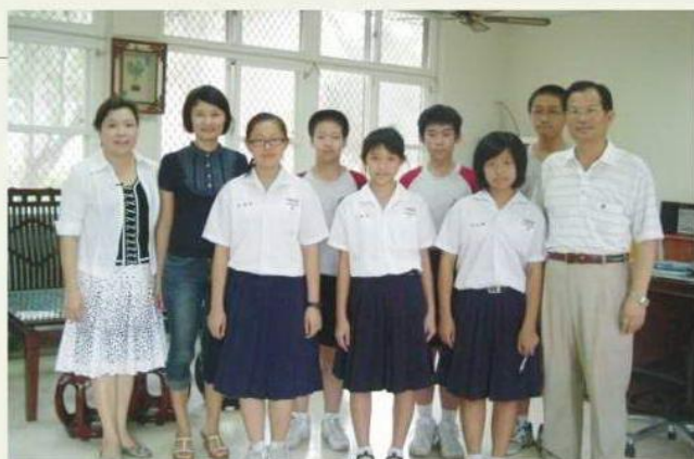
與東和國中受惠學生合照