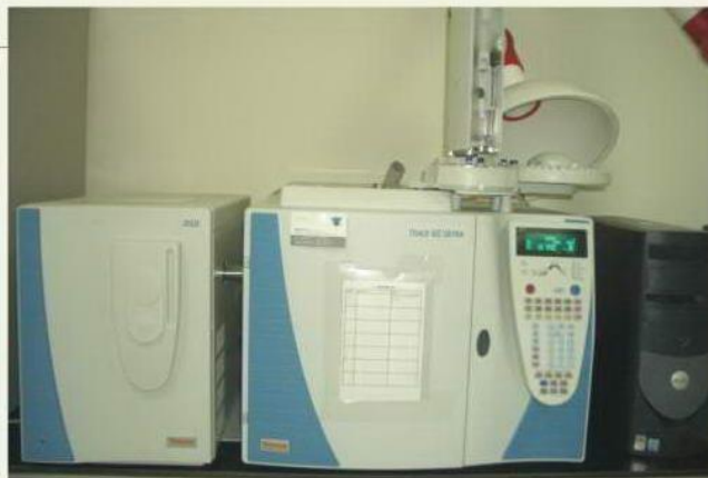
GC/MS 氣相質譜儀 分析項目：有機溶劑、偶氮等