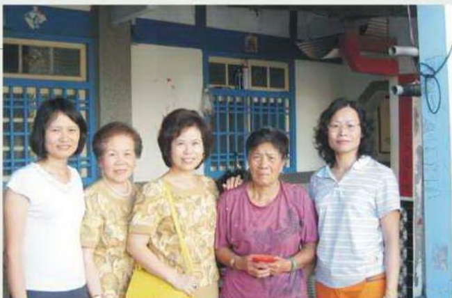
□湖鄉急難家庭救濟