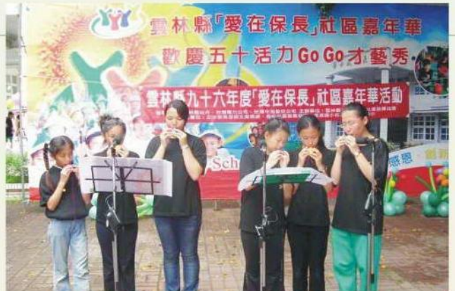
保長國小 愛在保長社區嘉年華活動