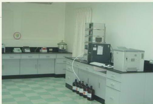
有機化合物分析室之一角