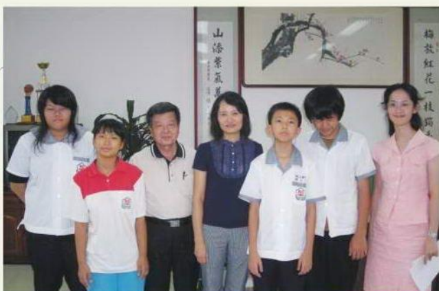
與梅山國中受惠學生合照