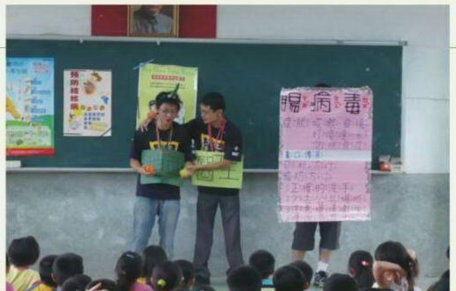
台北醫學大學 綠十字健康醫療服務隊麥寮鄉活動