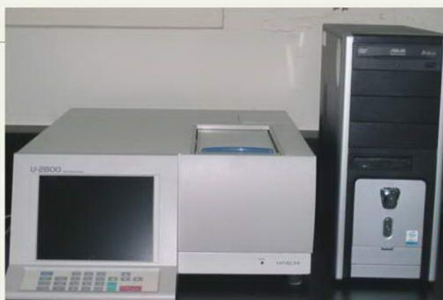
HUV/VIS-U2800紅外線分析儀 分析項目：甲醛、六價鉻等。