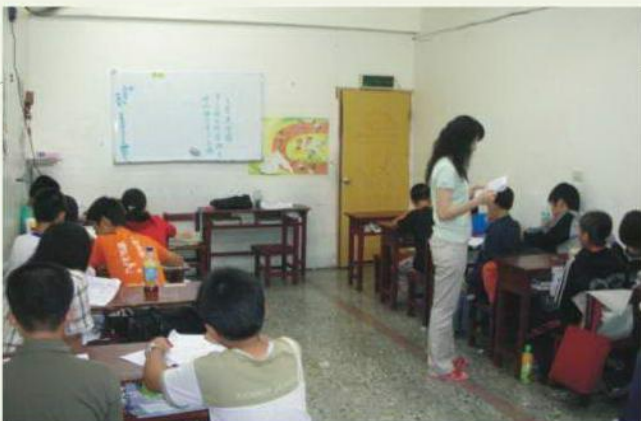
耕心家庭協會 弱勢家庭學童生活課輔先修班