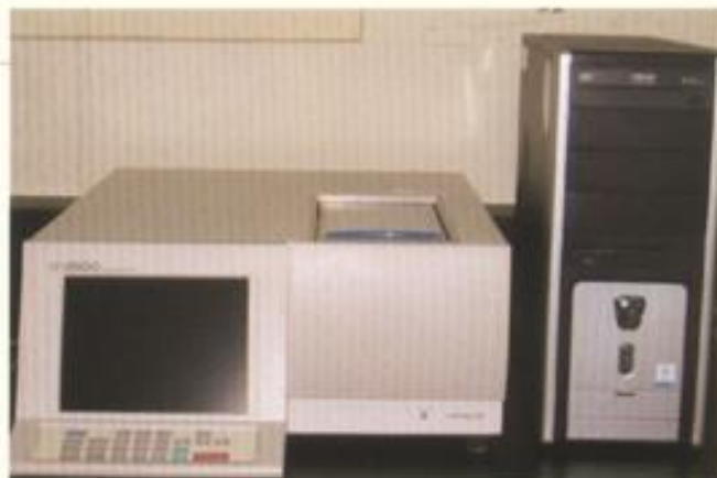
HUV/VIS-U2800紅外線分析儀 分析項目：甲醛、六價鉻等。