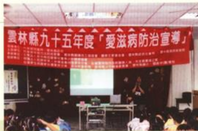
百里香關懷協會 愛滋病防治宣導