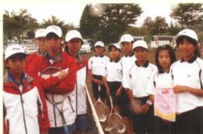
鎮東國小女網隊 日本中山湖青少年軟式網球賽