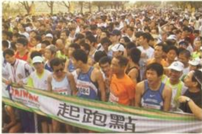
雲林縣政府—228國際馬拉松比賽