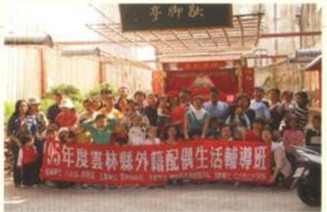
雲林家庭教育中心 外籍配偶及子女輔導活動