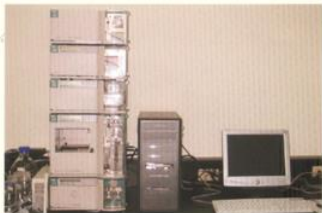
HPLC 液相層析儀 分析項目：分散性染料、偶氮等。