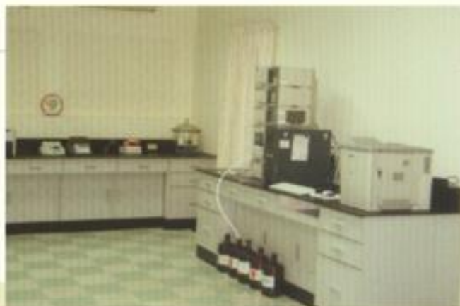
有機化合物分析室之一角