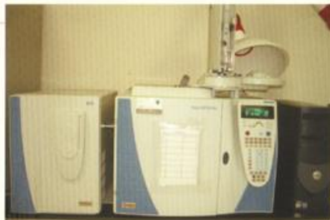
GC/MS 氣相質譜儀 分析項目：有機溶劑、偶氮等