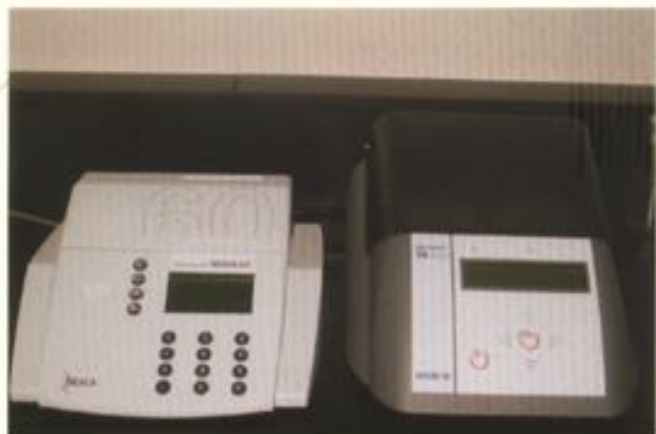
水質分析儀 分析項目：水中生化需氧量(BOD) 水中化學需氧量(COD)