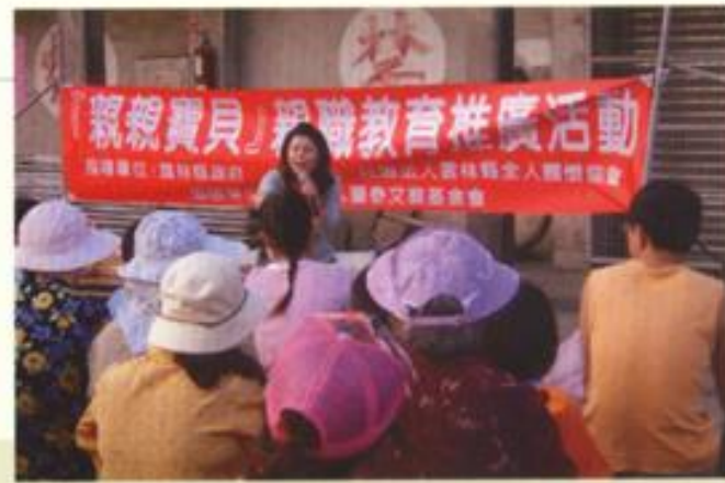
全人關懷協會 親親寶貝親職教育推廣活動