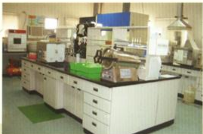
無機化合物分析室之一角