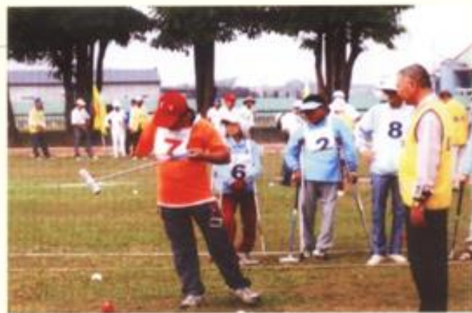
身心障礙福利協會 全國身心障礙者槌球錦標賽