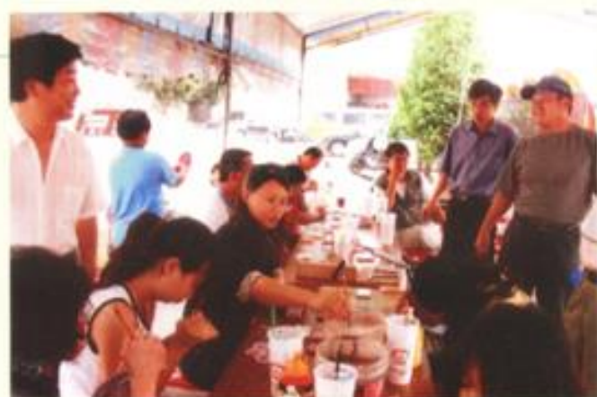
布嶼堡藝術協會 雲林縣背背藝術趕集文化產業活動