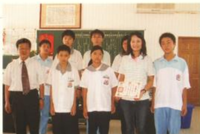
與梅山國中受惠學生合照