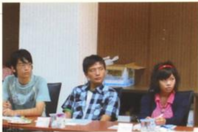
大專清寒新生暨優秀生獎助學金頒發座談會