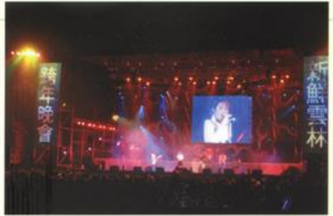
雲林縣文化基金會—新雲林2006跨年活動