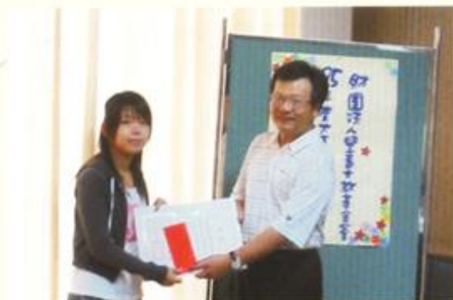
林執行長頒發大專清寒優秀生獎學金