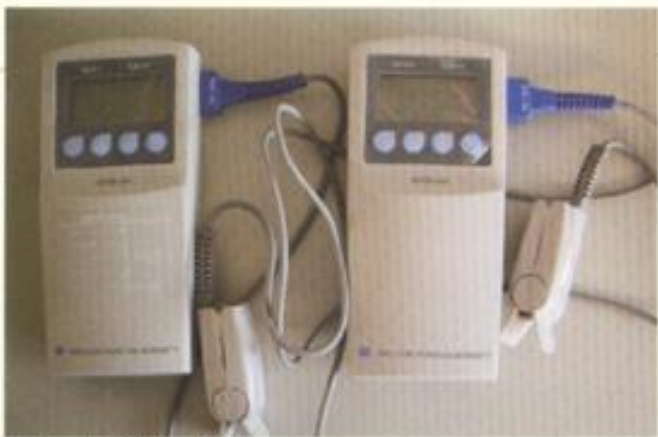
斗六消防分隊 購置救護車救護器材—血氧濃度儀