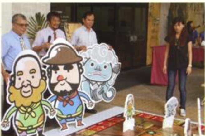
文化局—文化資產月活動