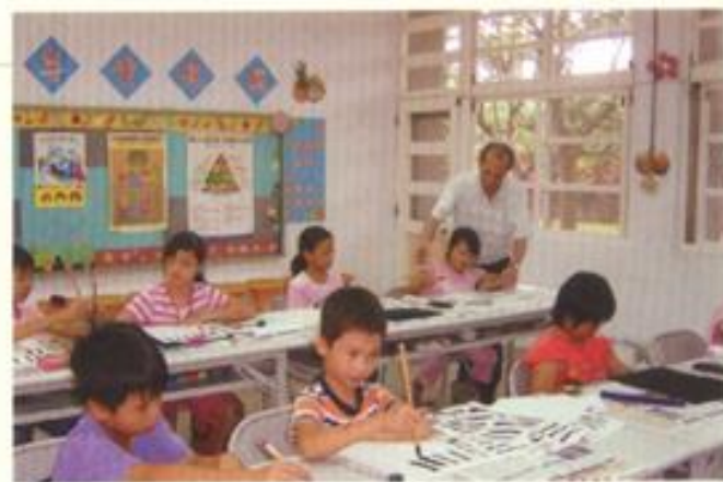
光復國小 邁向人文學校經典計劃—書法教學